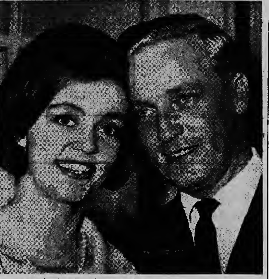
Muy pronto lo tin gran alegria na Suecia i ta di comprende cu enter e luga ta anhel e di dia grandi riba cu nan por felicitaf emeljal pareja aqui cu lo bai uni nan pa semper cu otro den laz matrimonial.